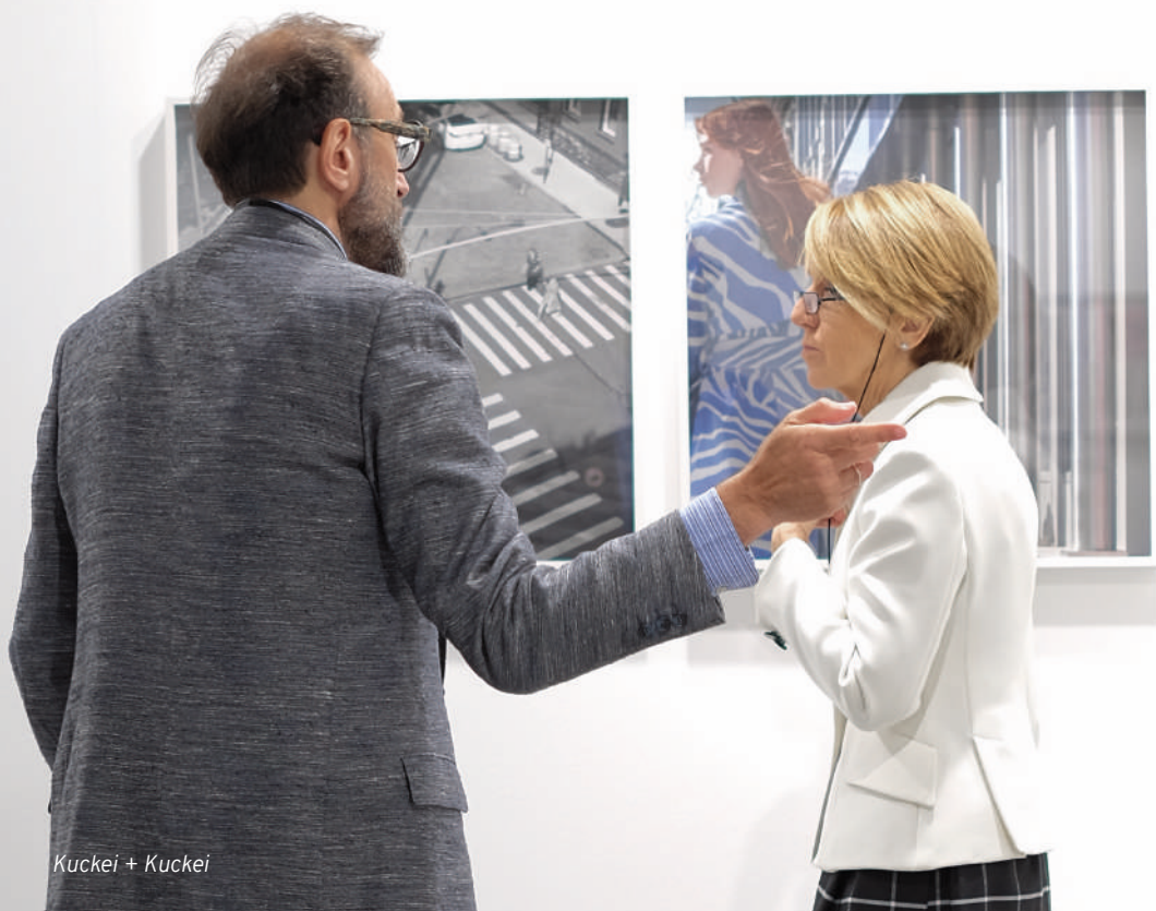
Kuckei + Kuckei

The Phair propone inoltre un programma di ospitalità rivolto a collezionisti selezionati e indicati dagli Espositori.